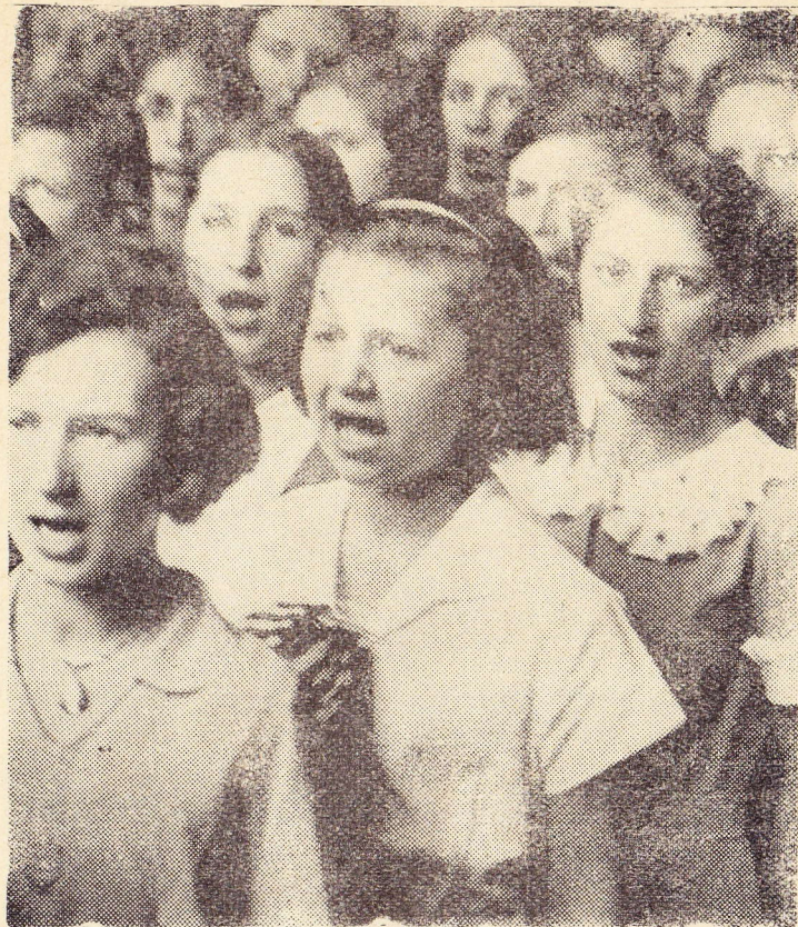
Meisjes zingen « De Wereld in » van Benoit.

Elkeen in Vlaanderen kende Benoit: een forschen man, sterk en breed gebouwd. Baard en